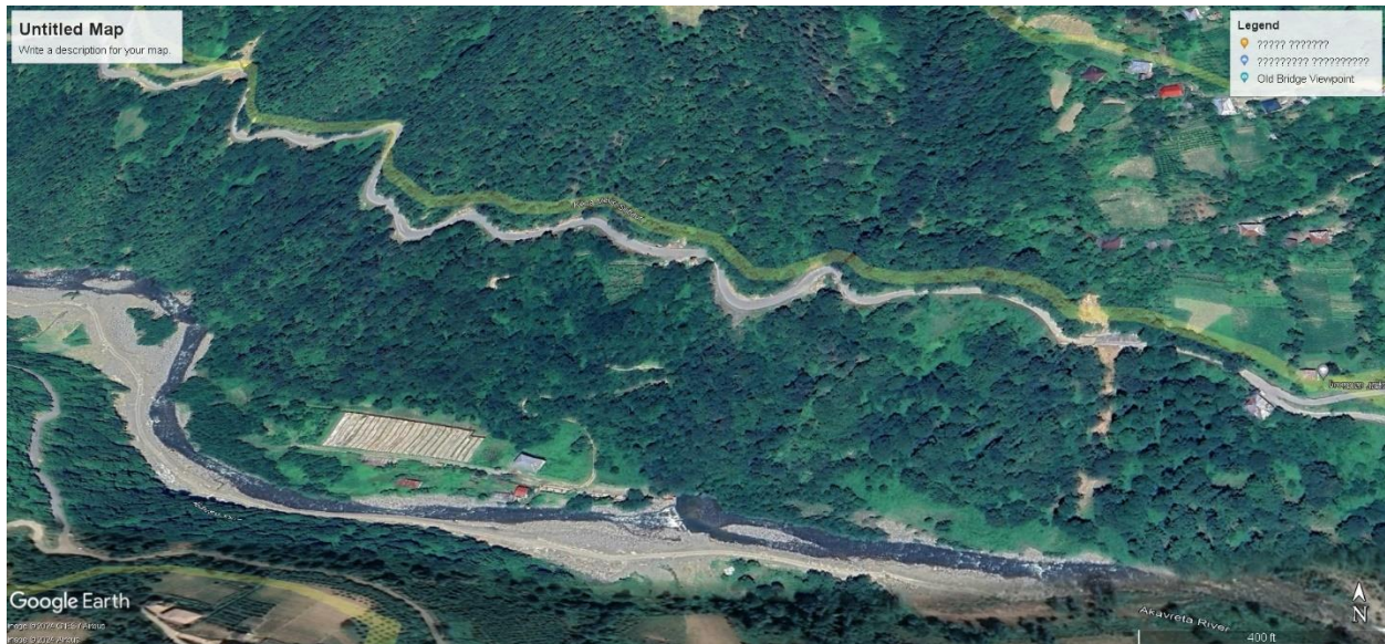
სურ. 2 საგარეუდო მარშრუტი დაბა ქედასა და სოფელ გუნდაურს შორის. შავშეთის ქედის ჩრდილოეთი მთისწინეთი, ქედას მუნიციპალიტეტი. (წყარო-Google Earth Pro).