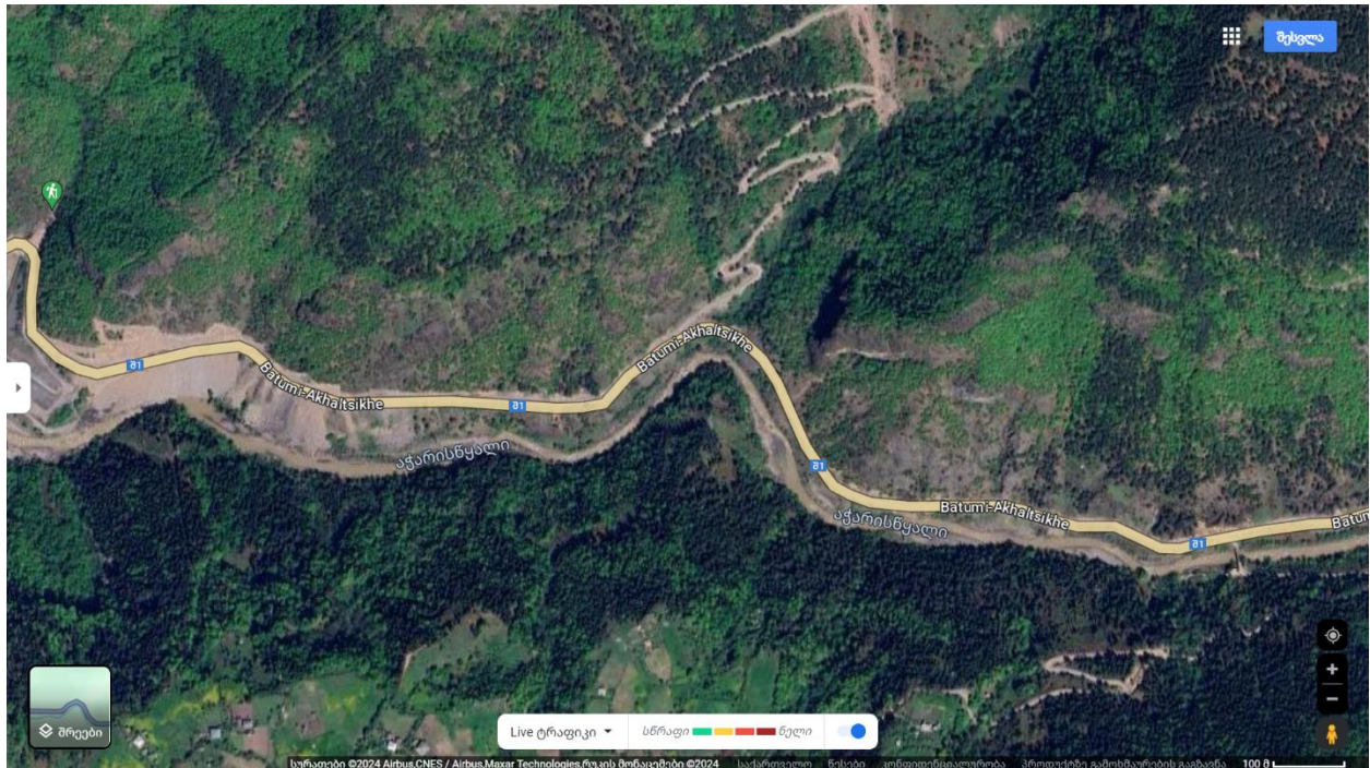
სურ. 6 სავარაუდო მარშრუტი დაბა შუახევისა და დაბა ხულოს შორის, მდინარე აჭარისწყალის ხეობა..