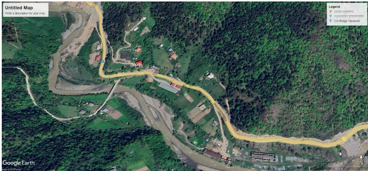
სურ. 4 სავარაუდო მარშრუტი დაბა შუახევის მახლობლად, მდინარე აჭარისწყალის ხეობა, ქედას მუნიციპალიტეტი..