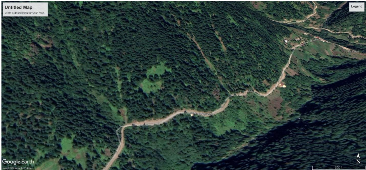
სურ. 5 სავარაუდო მარშრუტი სოფ. ინჯვირვეთის მახლობლად, ინჯვირვეთის მიმართულება, შუახევის მუნიციპალიტეტი. (წყარო-Google Earth Pro).