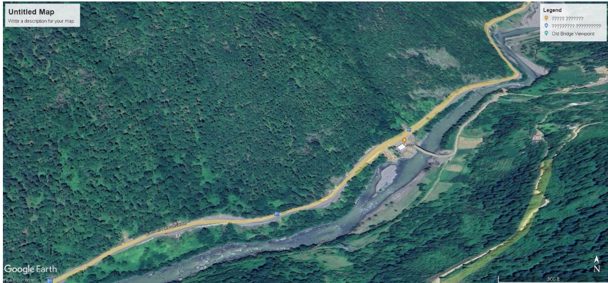
სურ. 3 სავარაუდო მარშრუტი დაბა ქედას მახლობლად, მდინარე აჭარისწყალის ხეობა, ქედას მუნიციპალიტეტი..