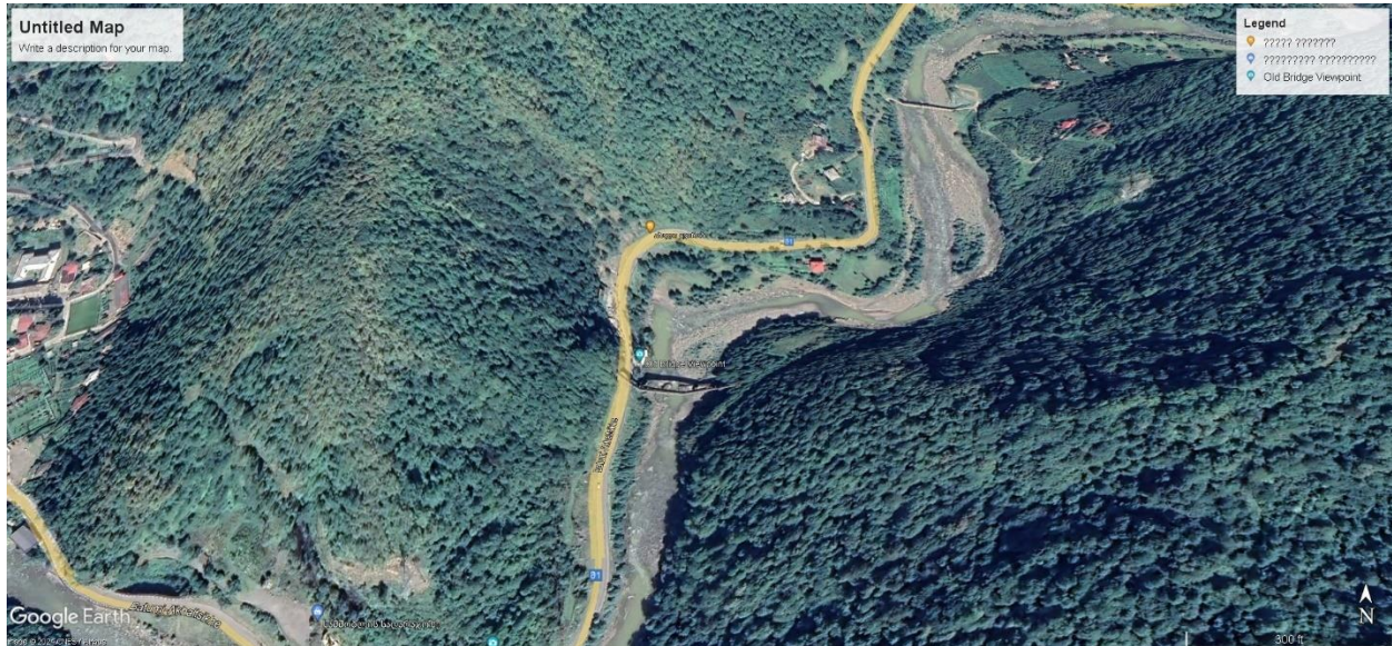
სურ. 1 საგარეუდო მარშრუტი სოფელ ქვედა მახუნცეთსა და დაბა ქედას შორის. მდინარე აჭარისწყალის ხეობა, ქედას მუნიციპალიტეტი. (წყარო-Google Earth Pro).