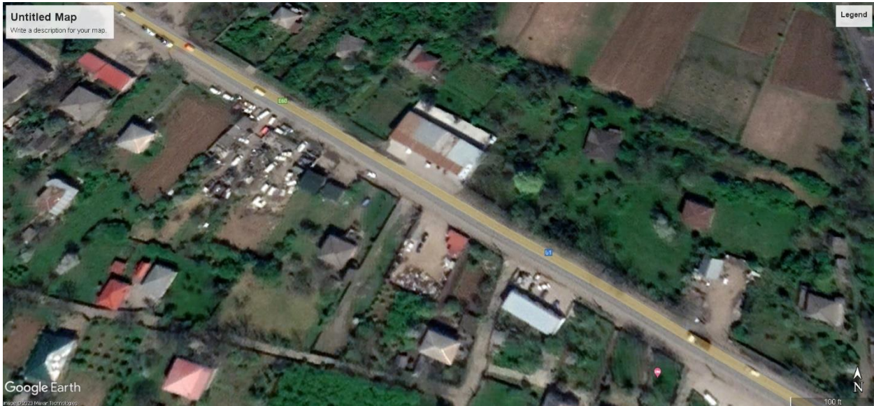
სურ. 1 სავარაუდო მარშრუტი ქალაქ ზესტაფონთან (ზესტაფონის მუნიციპალიტეტი) (წყარო - Google Earth Pro).