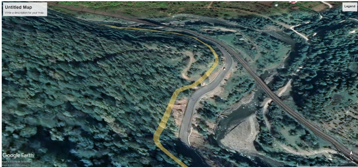
სურ. 3 სავარაუდო მარშრუტი ქალაქ ხარაგაულსა და სოფ. საღანძილეს შორის, ჩხერიმელას ხეობა, (ხარაგაულის მუნიციპალიტეტი) (წყარო - Google Earth Pro).