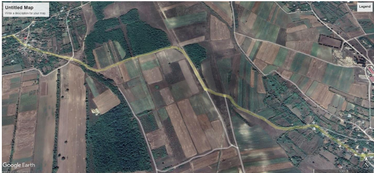
სურ. 6 სავარაუდო მარშრუტი სოფელ დიდი ფლევის მახლობლად, (ხაშურის მუნიციპალიტეტი).