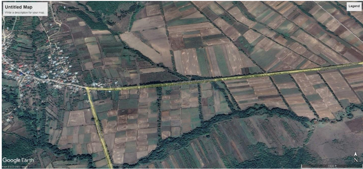
სურ. 5 სავარაუდო მარშრუტი სოფელ ზრილის მახლობლად, ლიხის ქედის აღმოსავლეთი მთისწინეთი, (ხაშურის მუნიციპალიტეტი).