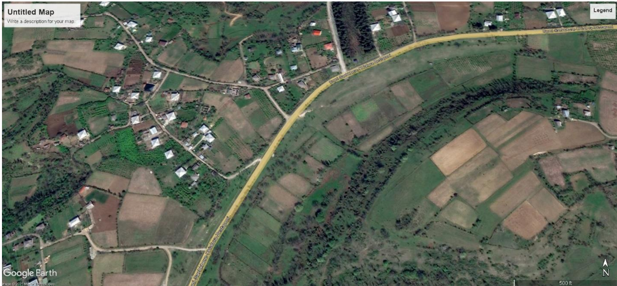
სურ. 2 სავარაუდო მარშრუტი სოფლებს მარტოთუბანსა და დილიკაურს შორის (ზესტაფონის მუნიციპალიტეტი) (წყარო - Google Earth Pro).